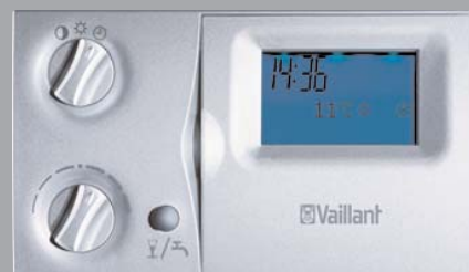
VRC 410 S

calorMATIC 360f. Gelijk aan de calorMATIC 360, maar draadloos. Geen kabel tussen thermostaat en ketel nodig.